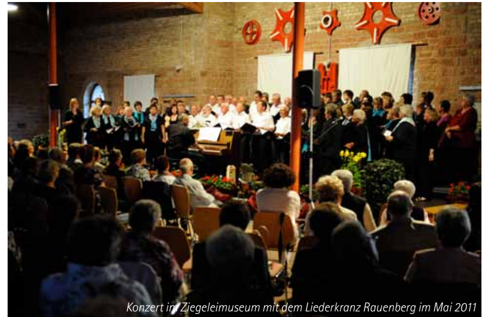
Konzert im Ziegeleimuseum mit dem Liederkranz Rauenberg im Mai 2011