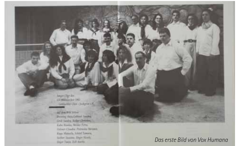
Das erste Bild von Vox Humana

1993 fuhren wir nach Stolpen bei Dresden.