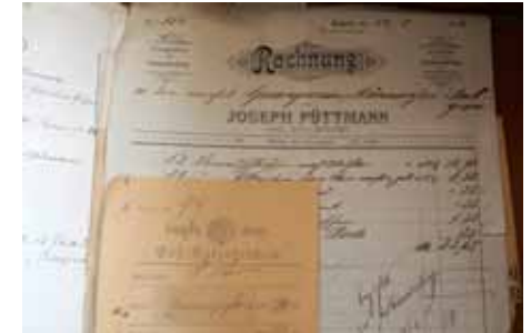
Kassenbuch aus dem Jahr 1901

Zweck des Vereins war die Veredelung des Volksgesanges. Mitglied konnte jeder unbescholtene männliche Bürger Jockgrims werden, der das 18. Lebensjahr erreicht hatte.