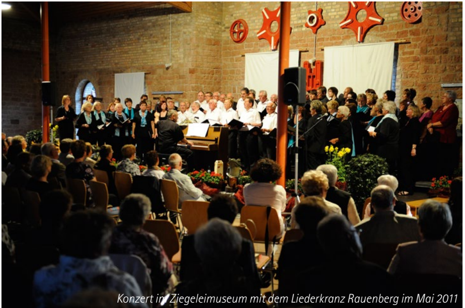
Konzert im Ziegeleimuseum mit dem Liederkranz Rauenberg im Mai 2011