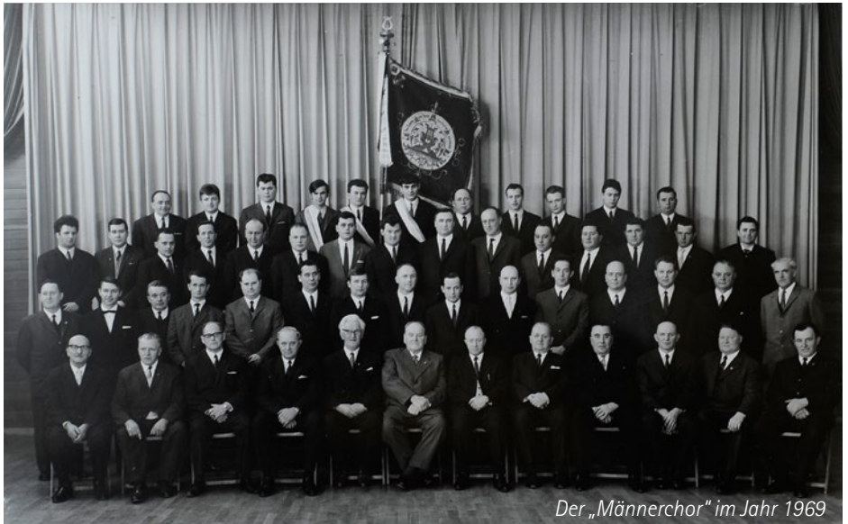
Der „Männerchor“ im Jahr 1969

Um dem Verein neuen Schwung zu geben, versammelten sich die Sänger und Interessenten am 24. Januar 1887 im Vereinszimmer des Gasthauses „Zum Ochsen“, und unter Karl