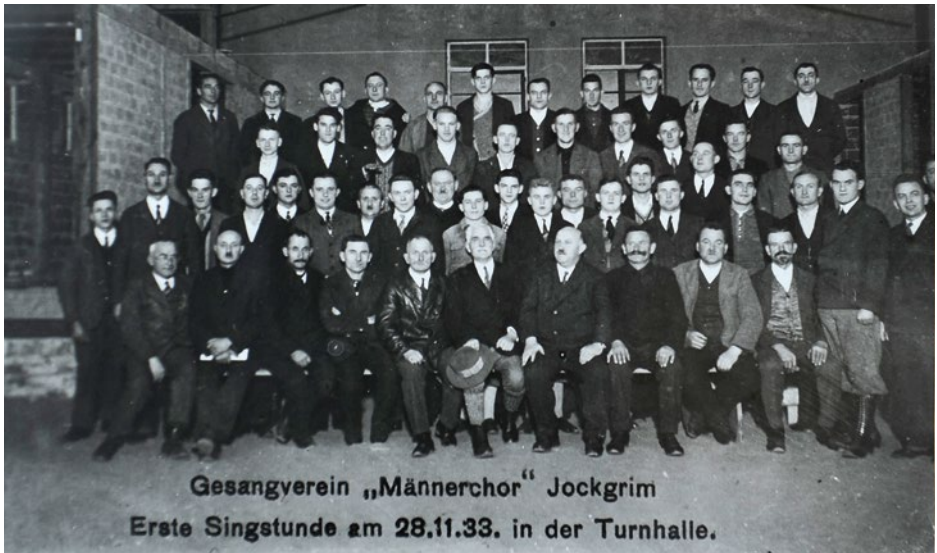
Gesangsverein „Männerchor“ Jockgrim Erste Singstunde am 28.11.33. in der Turnhalle.

in einer Versammlung durch die Annahme der Statuten mit 14 Paragraphen, unterzeichnet vom Vorstand, dem Ausschuss und allen 51 Mitgliedern, juristisch auf eigene Füße gestellt. Zweck des Vereins war die Veredelung des Volksgesanges. Mitglied konnte jeder