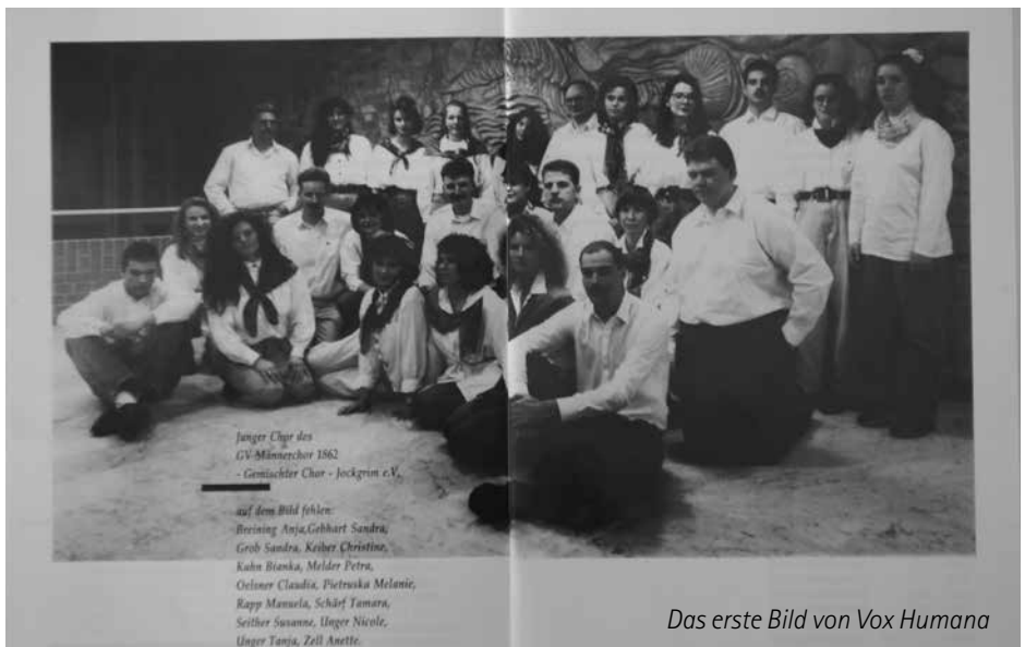
Das erste Bild von Vox Humana

Ebenfalls auf den Spuren der Jockgrimer Geschichte fuhren wir 1994 nach Aldain in