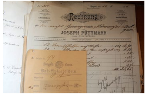
Kassenbuch aus dem Jahr 1901

unbescholtene männliche Bürger Jockgrims werden, der das 18. Lebensjahr erreicht hatte. Jedes angehende Mitglied hatte 30 Kreuzer Aufnahmegebühr zu entrichten. Aktive bezahlten jeden Monat in der ersten Singstunde 3 Kreuzer als Mitgliedsbeitrag, von den Passiven wurde dieser durch den Rechner einkassiert.